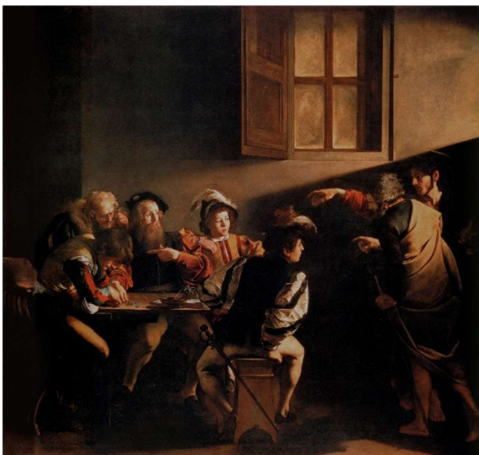
Michelangelo Merisi da Caravaggio, De roeping van Mattheüs , 1599-1600 (San Luigi dei Francesi, Rome)