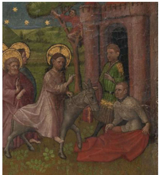
Anoniem, ca. 1435

Uit: Piet Thomas, In de Paaskring. Van Aswoensdag tot Pasen. Tobergse, 2022.