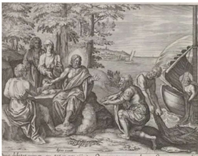
Christus verschijnt bij het meer van Tiberias, anoniem 1643