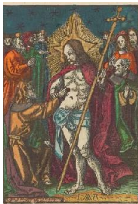
Jacob Cornelisz. van Oostsanen, 1520-1521