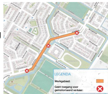
figuur 1: Werkgebied werkzaamheden Grotenhuysweg va. 23 maart

Het goede nieuws is dus: het wordt veiliger voor fietser en voor voetgangers.