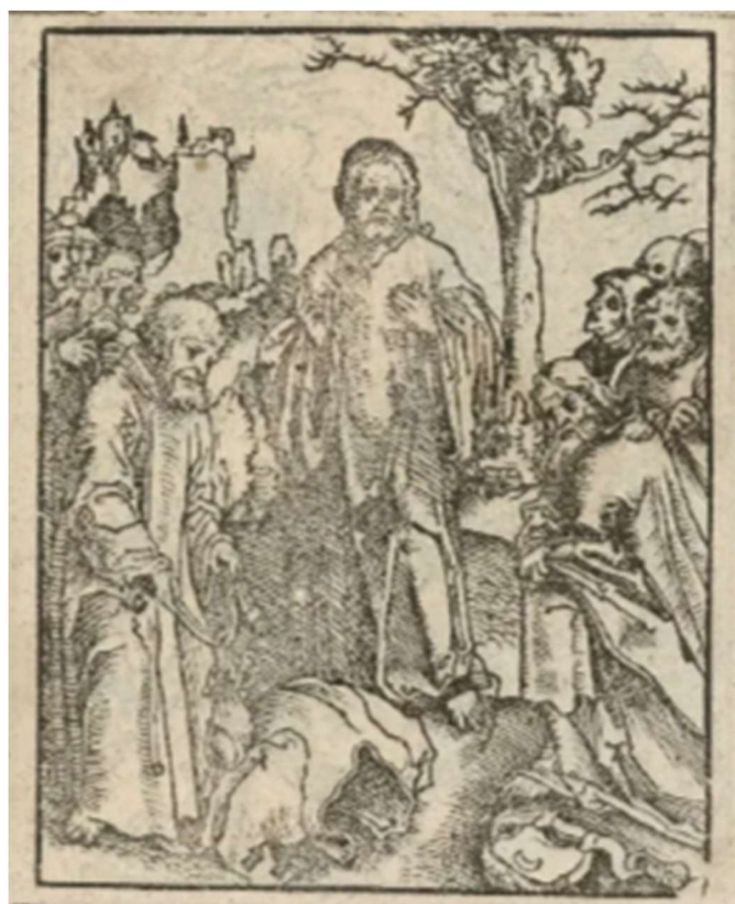
Christus onderwijst apostelen om afstand te doen van hun rijkdom, door Lucas Cranach, 1521-1522